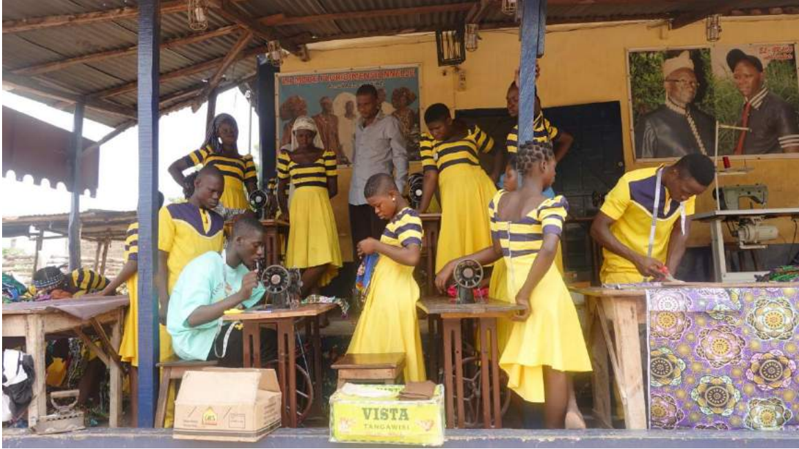
In het naaiatelier van Gratien leren nu 10 jongens en 45 meisjes het vak van kleermaker