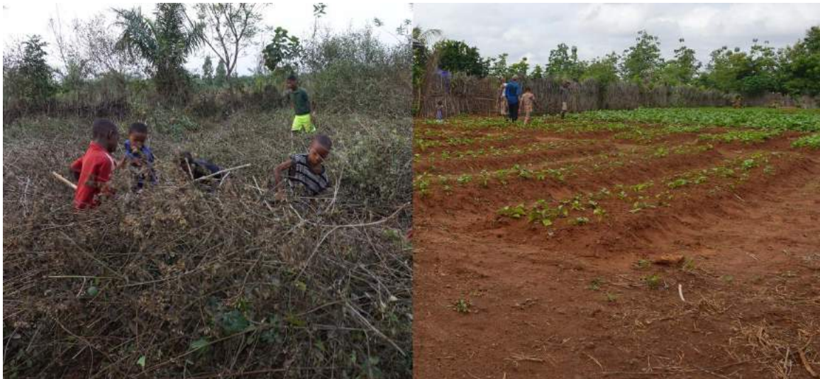
De moestuin in 2017 en 2021

In het najaar van 2021 zijn er genoeg bonen en maïs geogst voor eigen consumptie en bleef er ook nog over voor de verkoop. Een goede stap richting zelfvoorziening!