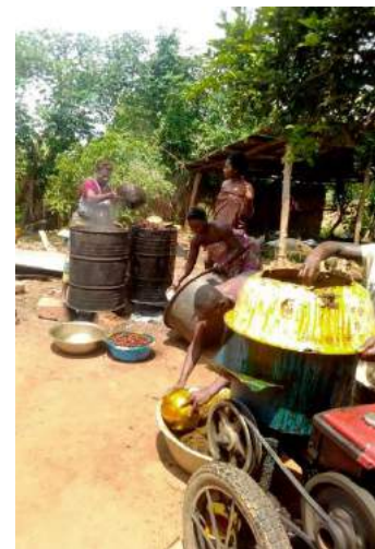
Oogst van maïs en productie van palmolie