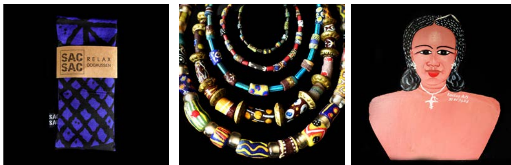
Originele cadeautjes voor de decembermaand

In Januari 2023 is de volgende diploma-uitreiking. Veertig jongeren zullen dan het diploma van hun beroepsopleiding ontvangen, vergezeld van een startpakket zodat ze hun eigen atelier kunnen opzetten. Dit keer zijn het 37 kleermakers, 3 kappers en 1 monteur.