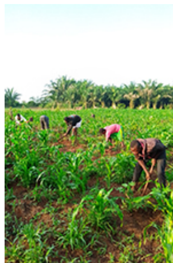
De landbouwgrond levert heel veel mais, igname en palmnoten